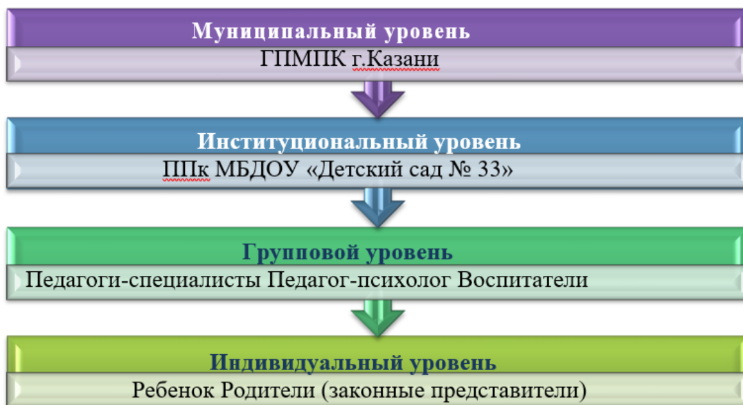
Схема взаимодействия по вертикали